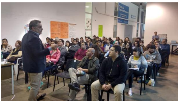
Club de Emprendedores de Florencio Varela