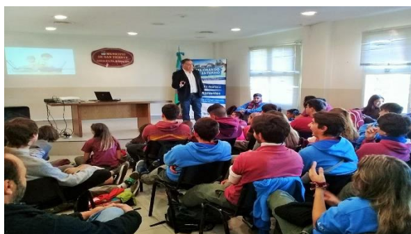
Escuela Secundaria San José – San Vicente