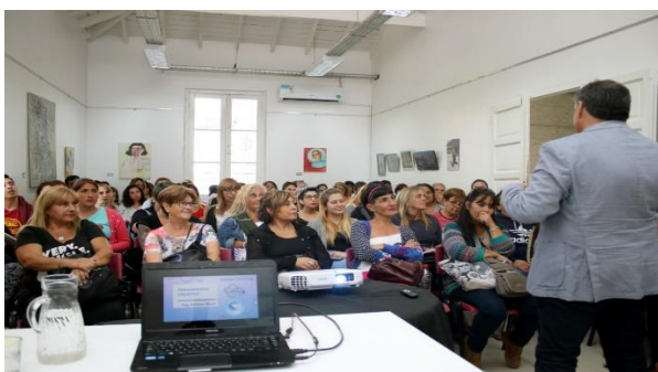
Club de Emprendedores de Lanús